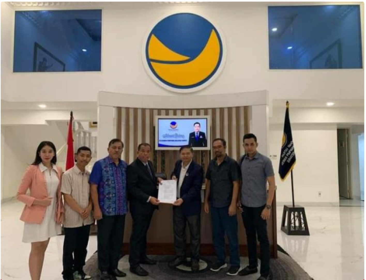
Sah/Resmi Partai Nasdem Usung Paslon Antonius -Komando diPilkada Karo 2024

KARO - DPP Partai NasDem secara resmi menyatakan dukungan terhadap bakal